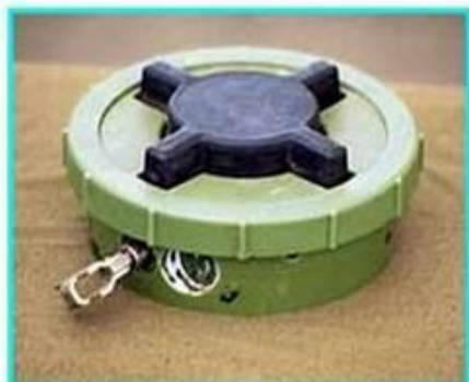
Рис.1 Общий вид мины ПМН-2