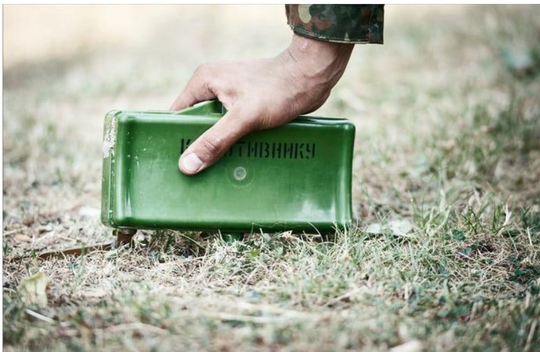
Мина в боевом положении